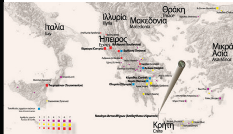
© The Antikythera Mechanism Research Project – M. Anastasiou and Designbond.

The exhibition will travel outside Greece too and in the autumn of 2011 it will be incorporated in the major exhibition about the Antikythera shipwreck scheduled at the National Archaeological Museum, organized by: the Program of History, Philosophy and Didactics of Science and Technology (Institute for Neohellenic Research of the National Hellenic Research Foundation, in association with the Athens Science & Education Laboratory of the Faculty of Primary Education, University of Athens), the Antikythera Mechanism Research Project, the National Archaeological Museum and the Society for the Association for Ancient Greek Technology Studies.