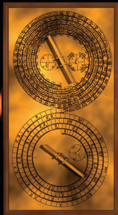
© Tony Freeth & the Antikythera Mechanism Research Project

It's a complex astronomical computer that tracks the cycles of the Solar System, i.e. the calendars, the phases and positions of the Sun and the Moon. Also, it predicts the solar and lunar eclipses and, possibly, the positions of the planets. Recently, it was discovered that the Mechanism included a four-year display, the Olympiad Dial, which tracked the cycle of the Panhellenic Games!